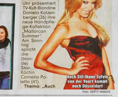
Auch Stil-Ikone Sylvie van der Vaart kommt nach Düsseldorf!

Düsseldorf - Auf der Beautymesse (15.-17. März) geben sich sexy Blondinen die Klinke in die Hand! Den Anfang macht Pamela Anderson (55). Die „Baywatch“-Nixe lässt sich am Freitag (10 Uhr) die Nägel am Alessandro-Stand machen. Um 15.30 Uhr präsentiert TV-Kult-Blondine Daniela Katzenberger (26) ihre neue Handpflege-Kollektion „Mallorca Summer“. Am Sonntag spricht die (blonde) Star-Köchin Cornelia Poletto (41). Thema: „Auch Schönheit geht durch den Magen“. Bei der Top Hair (16.-18. März) übernimmt dann Sylvie van der Vaart (34) das Blondinen-Zepher. mv